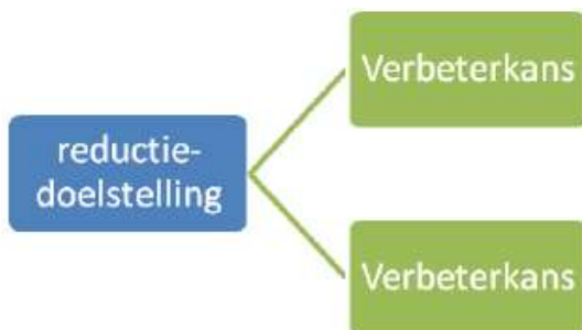
Figuur 4. Inbrengen verbeterkans(en) in organisatie.

Uit de reductiedoelstelling volgen één of meerdere verbeterkansen. De gekozen verbeterkansen op het gebied van CO 2 -reductie, zullen worden ingebracht in de organisatie. Dit kan tijdens verschillende overlegvormen plaatsvinden, één en ander is afhankelijk van het type verbeterkansen.