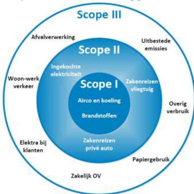
Figuur 2. Scopediagram gebaseerd op het scopediagram van SKAO

De scope I, II en III emissies worden weergegeven in onderstaand figuur.